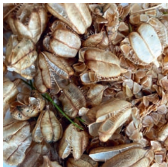
Samenkapselfn und Samen

Die Samensammelaktionen verbinden Schule und Arbeitsgemeinschaft Umweltschutz seit 1995. Schon bei der Anpachtung der Schachblumenwiesen 1992 dachten wir, dass es doch schön wäre, wenn die Schachblumen nicht nur das Hetlinger Wappen zieren, sondern auch jeden Hetlinger Garten.