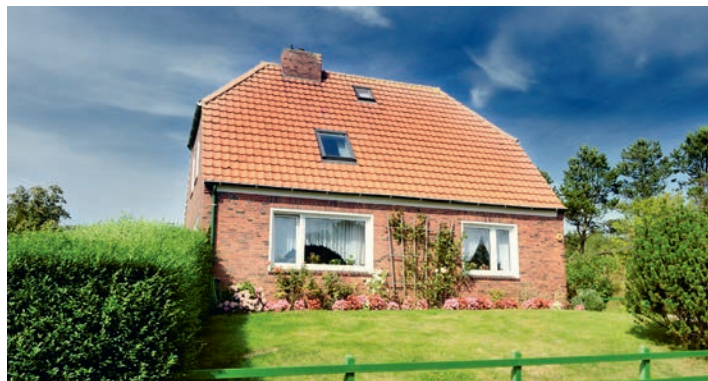
Der private Verkauf einer Immobilie ist komplex und risikoreich.

Verkäufer nutzen oft unzureichende oder einfach zugängliche Daten, die ihre Preisvorstellungen bestätigen, aber keinen vollständigen Markteinblick bieten.