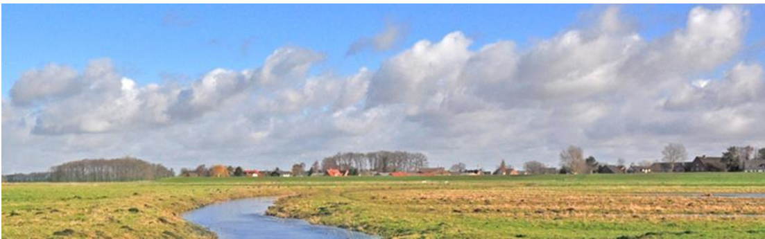
Hetlingen - die idyllische Elbmarschengemeinde im Hamburger Umland